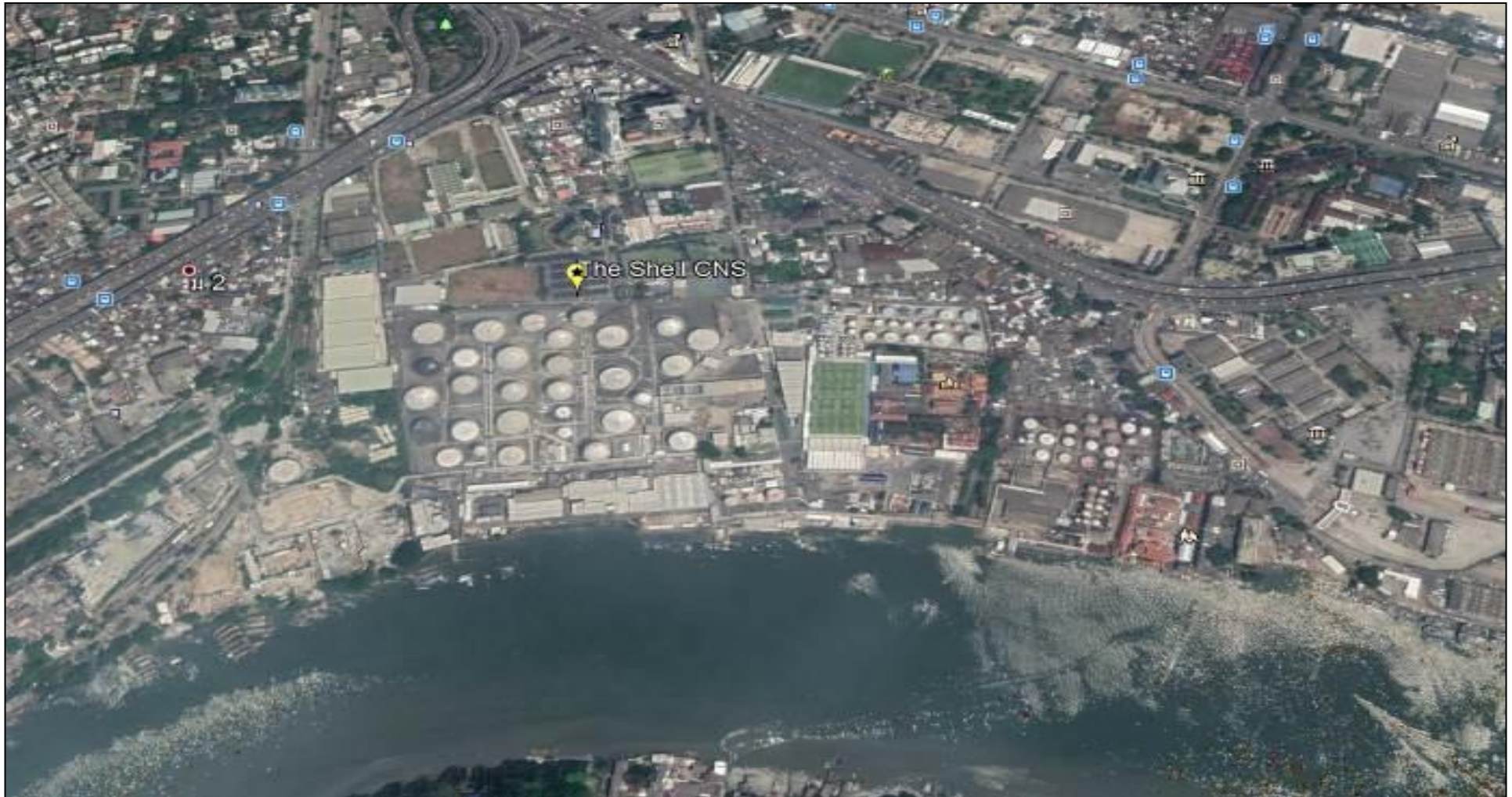
รูปที่ 1.4.2-1 แผนผังแสดงตำแหน่งท่าเทียบเรือและคลังน้ำมันเชลล์ช่องนนทรี